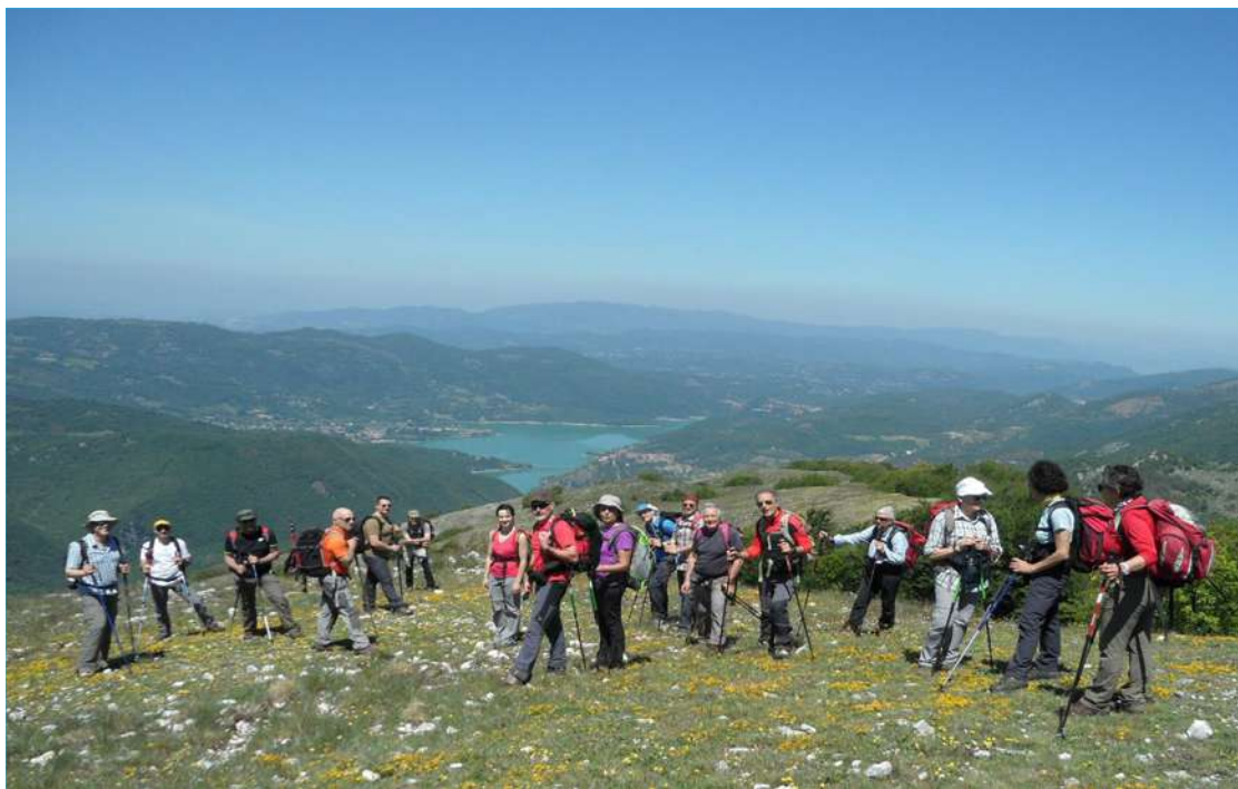
...il gruppo si riunisce al completo in posa per una bella foto...