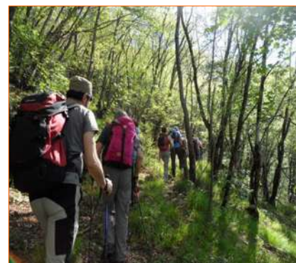
...entriamo nel bosco...