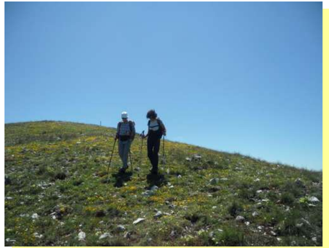
...tra una chiacchera e l'altra...