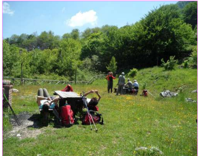
...SVEGLIA, si riparte!!...