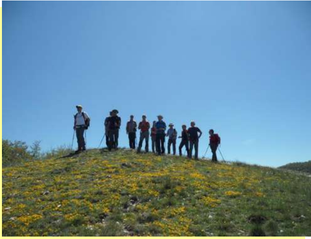
...sulla cresta in fiore...