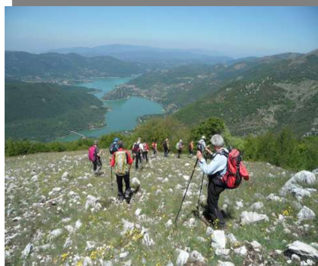
...rivolti verso il lago cominciamo a scendere...