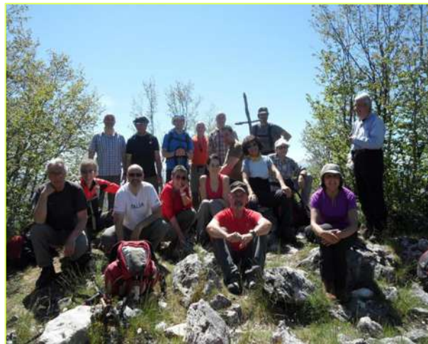
un'altra breve una breve salita.....e siamo in vetta in perfetto orario...