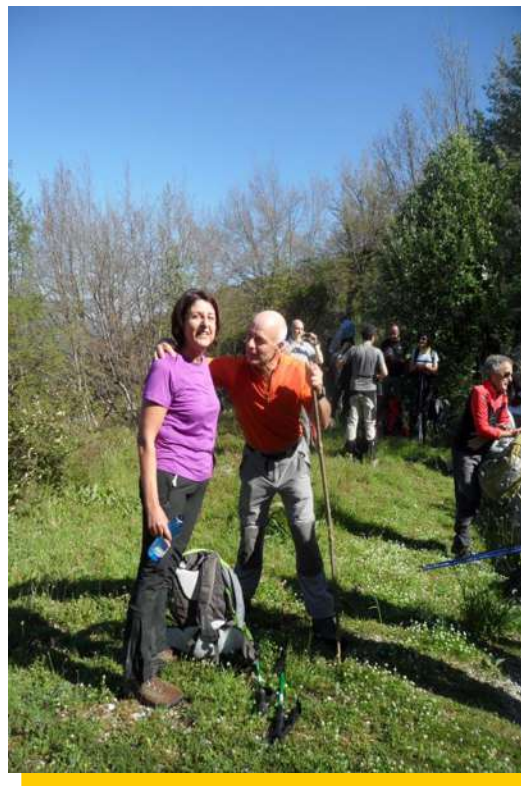
.....un tentativo di seduzione...