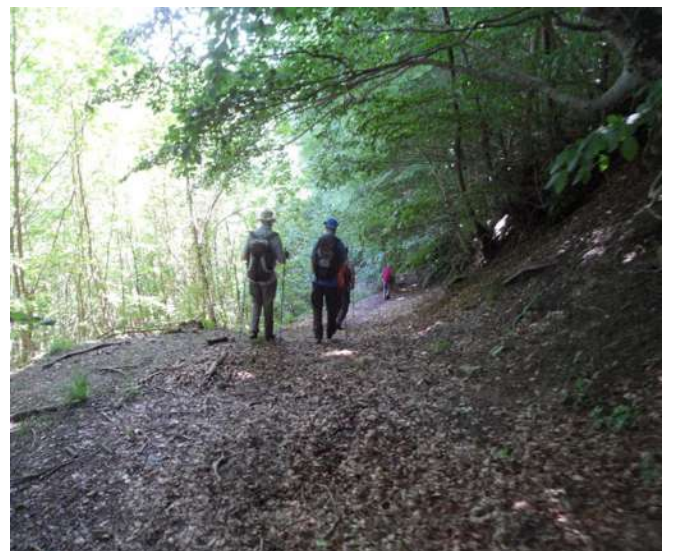
...entriamo e usciamo dal bosco...