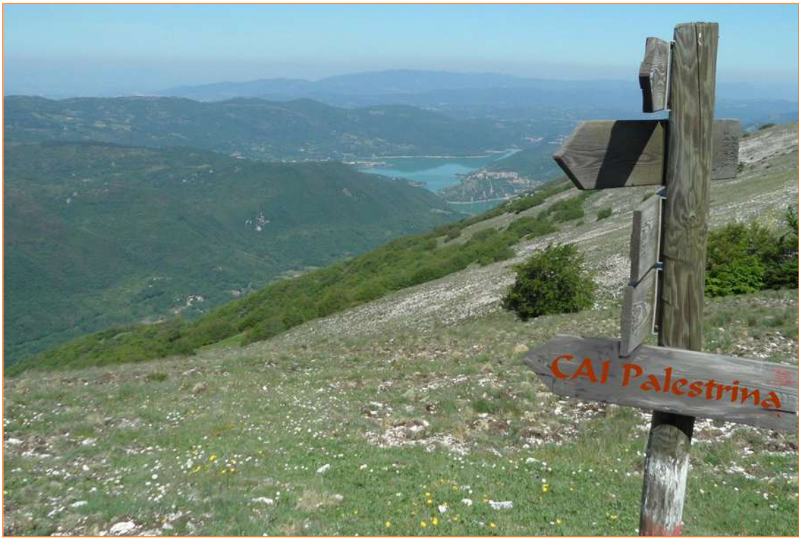
...il sentiero è quello giusto...