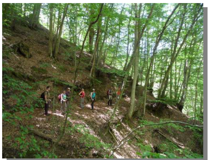
...e superato prima un fosso...