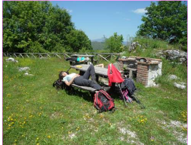
...pausa pranzo... "pennichella" compresa...