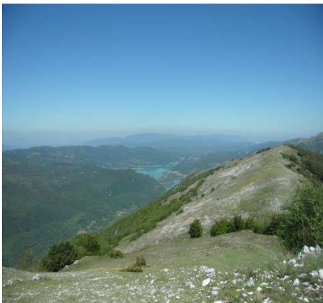
Sullo sfondo il lago del Turano