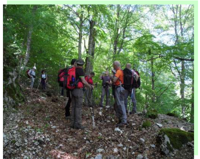
...una pausa per riunire il gruppo...