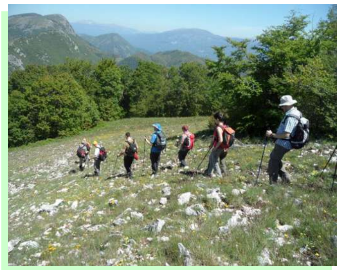
...puntiamo dritti verso il bosco....