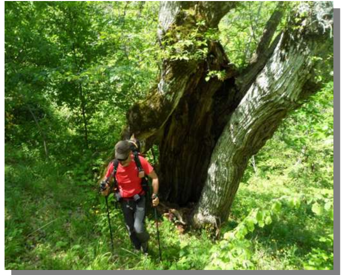
.... subito una sorpresa.....un gigantesco albero...