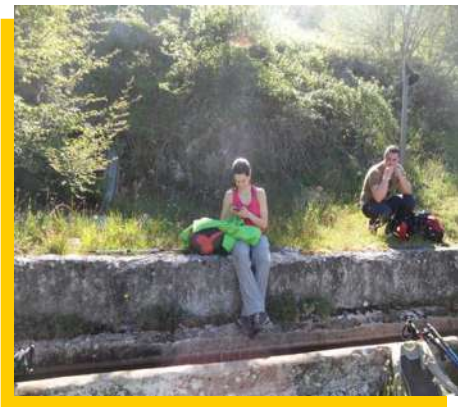
...un fugace sguardo...