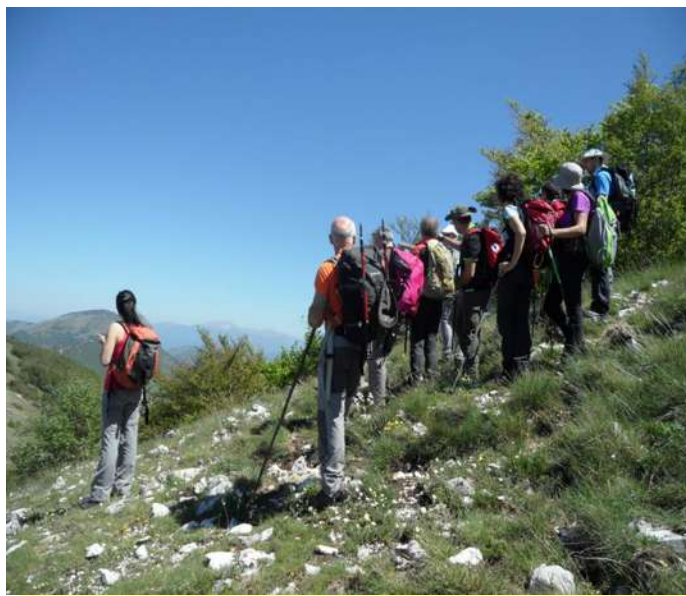
Uno sguardo al Monte Navegna...