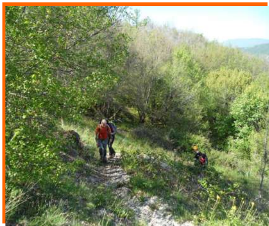
...si riprende il cammino...