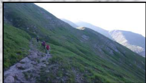
Tracciolino di Annibale