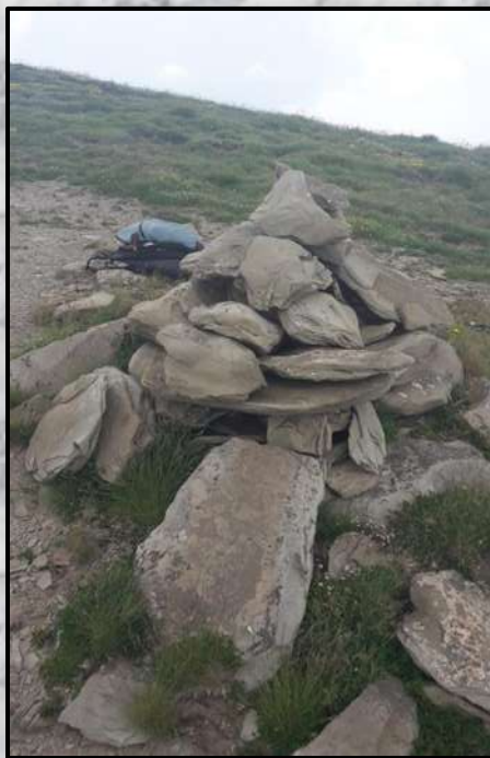
Ometto del Monte Pelone