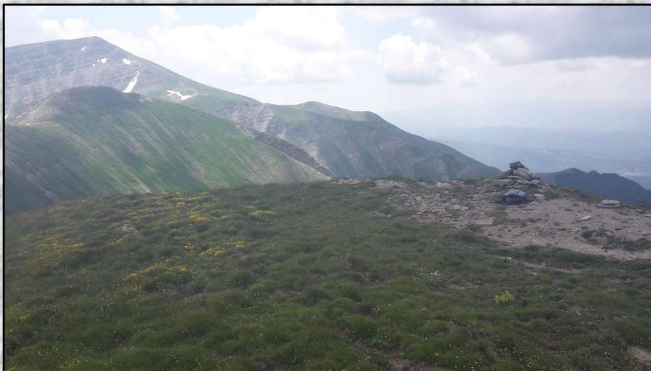
Monte Pelone con sullo sfondo il Gorziano