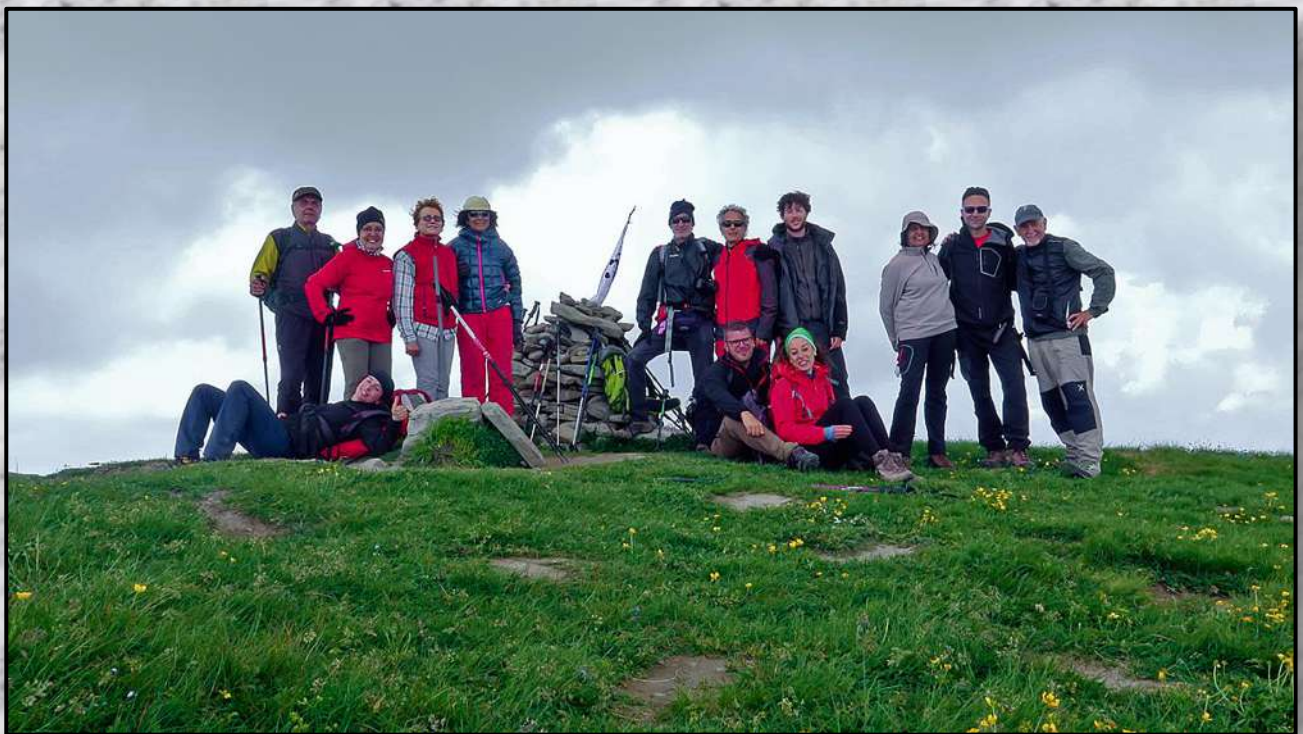
Sul Monte Gorzano