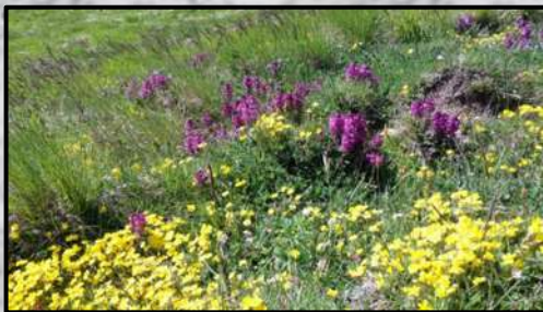
Fioritura di orchidee