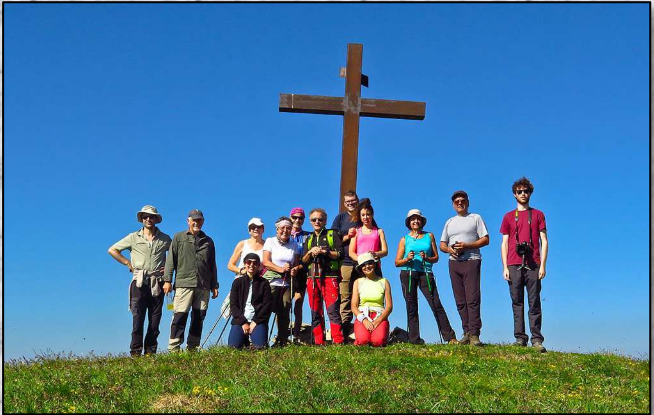
Pizzo di Sevo