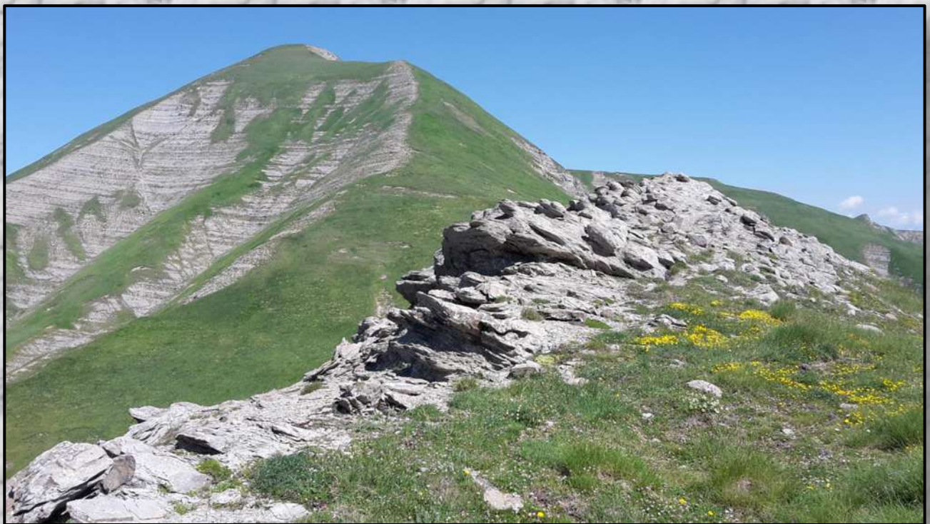
Salendo a cima Lepri con vista su Pizzo di Sevo