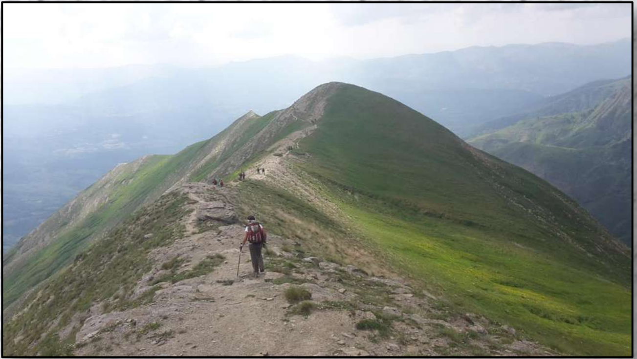
Discesa dal Gorzano verso il sacro cuore