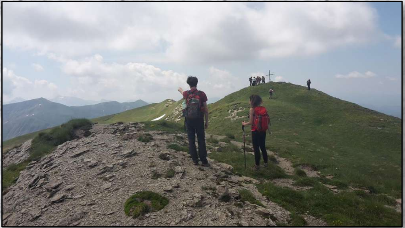
Salendo a Cima Lepri