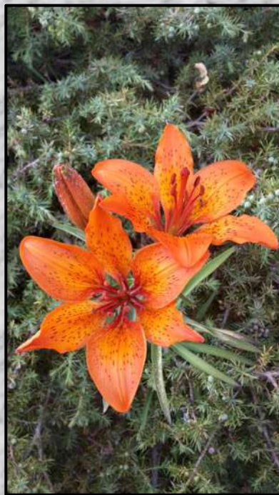
Giglio di S. Giovanni