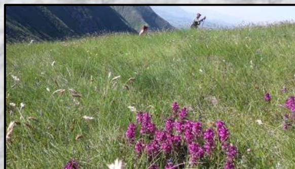
Salendo al pizzo